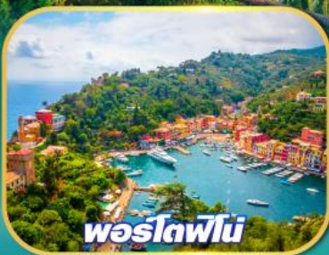
พอร์โตฟีโน