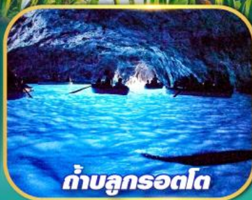
ถ้ำบลูกรอดโก