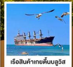
เรือสินค้าก่ายตันบลูวิส