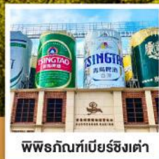
พพิธภัณฑที่เบียร์ชิงเต่า