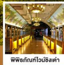
พพิธภัณฑที่ไวน์ชิงเต่า