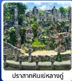
ปราสาทหินเย่หลางกู๋

● ไฮไลท์ น้ำตกหวงกั๋วซู่ น้ำตกที่ใหญ่ที่สุดของจีน แหล่งท่องเที่ยวระดับ 5A ชมความสวยงาม หมู่บ้านวูเจียงจ้าย หมู่บ้านจินโบราณ