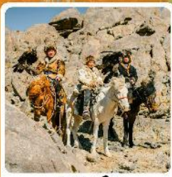
ชาวมองโกล