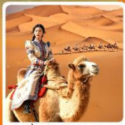
ขี่อูฐชมทะเลทราย