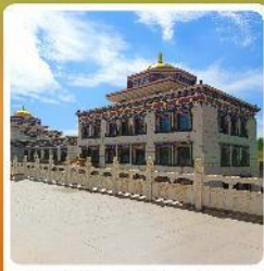
ทำเนียบพระลามะอูหลาน

• ไฮไลท์ เป็นทราเวลเชิงชาวนา แหล่งท่องเที่ยวระดับ 5A ของจีน แกรนด์แคนยอนแม่น้ำเหลือง ซี่อูฐท่ามกลางทะเลทราย