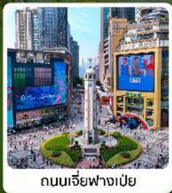
ถนนเจียฟางเป่ย์