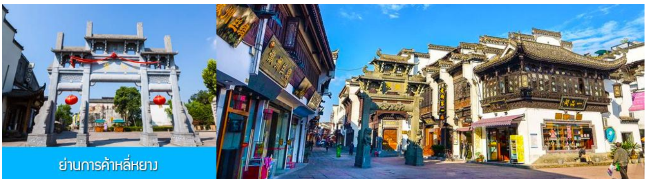
ย่านการค้าลี่หยาง

เที่ยง อิสระอาหารมื้อกลางวัน ( ท่านสามารถเลือกชิมอาหารพื้นเมืองในระแวกโรงแรมได้ตามอัธยาศัย )