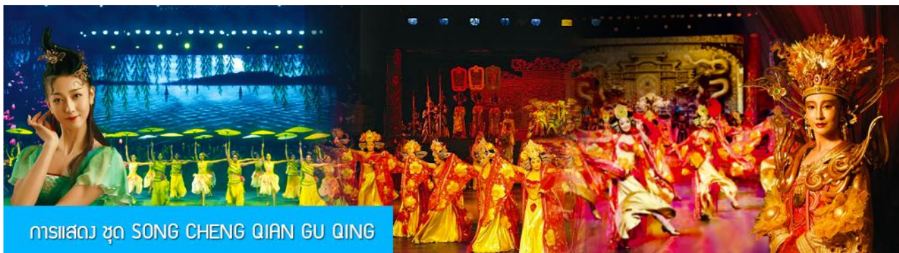
การแสดง ชุด SONG CHENG QIAN GU QING