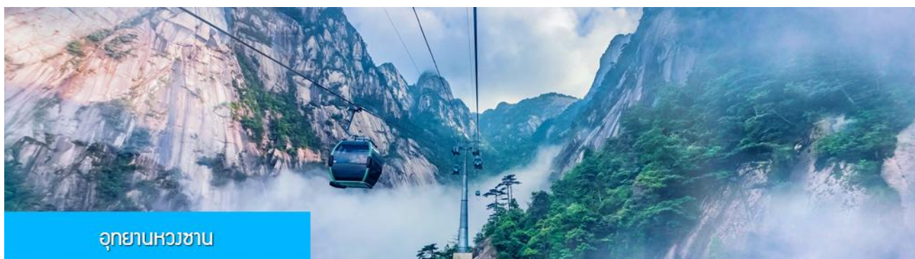
อุทยานหวงซาน

พักที่ โรงแรม ANXIANG RUILAIKE HOTEL 4* หรือเทียบเท่าในเมืองหางโจว