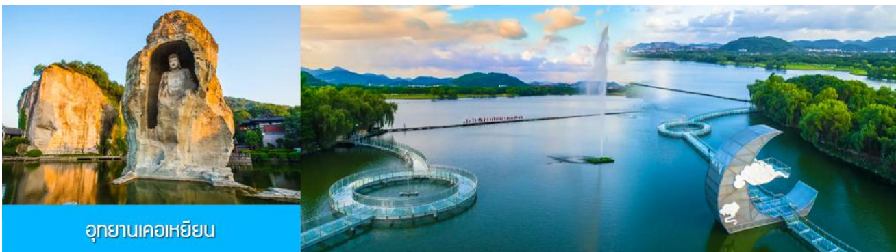
อุทยานเคอเหยียน

พักที่ โรงแรม KAIYUAN MINGTING HOTEL 4* หรือเทียบเท่าในเมืองเส้าชิง