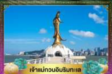
เจ้าแม่ทวนอิมริมทะเล