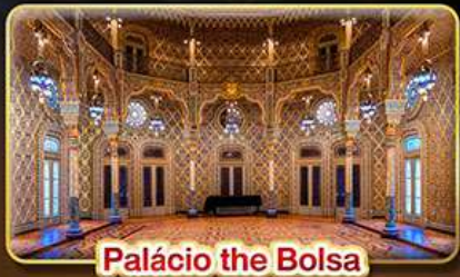
Palácio the Bolsa