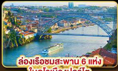
ล่องเรือชมสะพาน 6 แห่ง ในคูโรเมืองปอร์โต