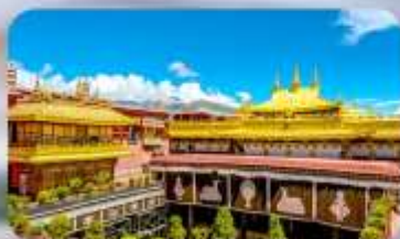
วัดโจกิง