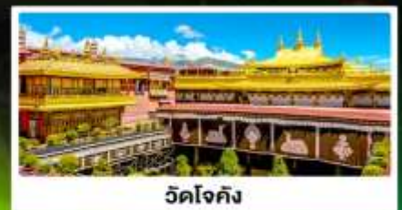
วัดโจกิง

🏠 พักบนรถไฟ 1 คืน ห้องละ 4 เตียง (บน 2/ล่าง2)