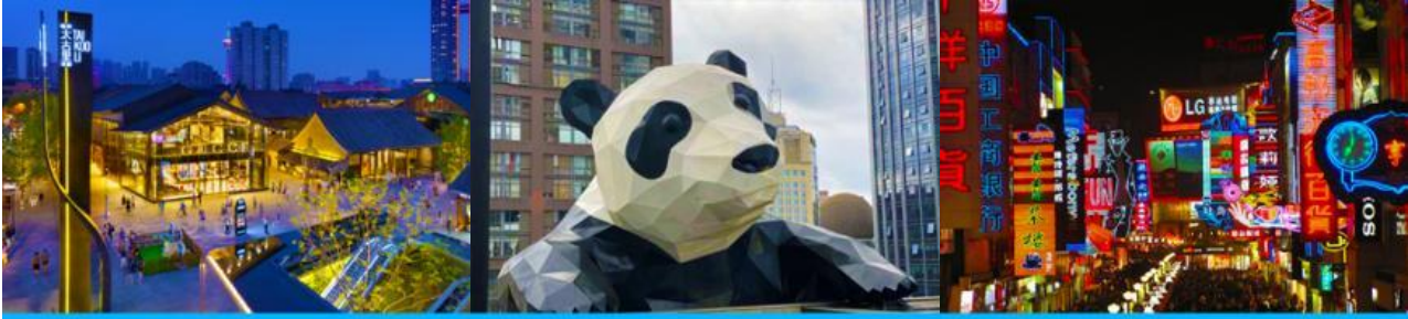
ถนนไท่กุ่หลี่ และวัดต้าฉือ