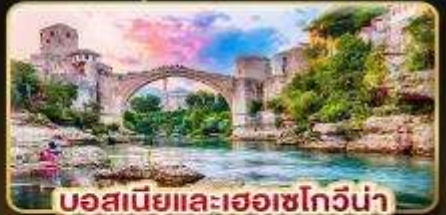
บอสเนียและเฮอร์เซโกวีนา