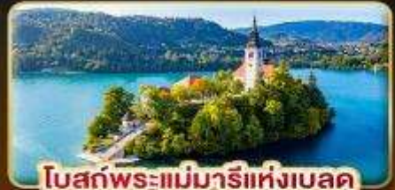
โบสถ์พระแม่มาเรียแห่งเบลด