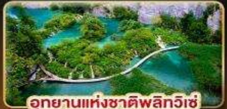
อุทยานแห่งชาติพลิวีเช