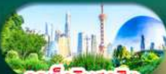
จุดเช็กอินสุดฮิต North Bund Shanghai

เชียงใหม่ หางโจว ล่องทะเลสาบซีหู ฟรีเดย์