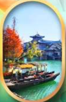
เมืองโบราณผู้หยวน