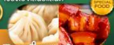
พิเศษ เสี่ยวหลงเป่า หมูแดงพอ เดินทาง ม.ค. - มิ.ย. 69