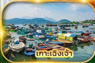
เกาะเจิงเจ้า