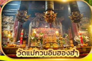
วัดแม่กวนอิมสองฮ่า