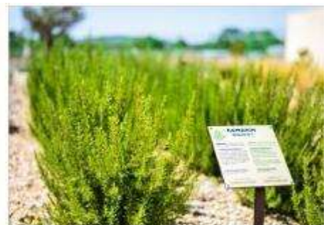
The Mediterranean Garden