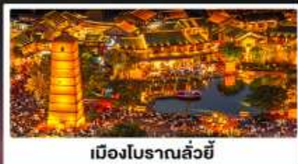
เมืองโบราณลี่ยี