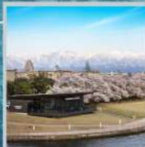
"TOYAMA KANSUI PARK"