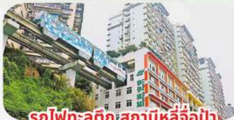
รถไฟฟ้าสถานีหลี่จื่อปา