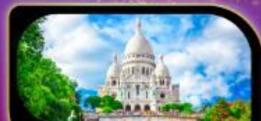
วิหารสกรทอร์ มงมาร์ต