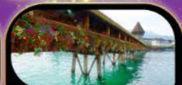
สะพานไม้ชาปค ลูซิิร์น