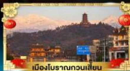
เมืองโบราณกวนเสียน