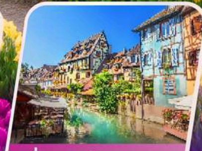
เที่ยวแคว้นอาลซัส