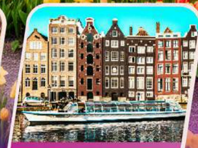
ล่องเรือหลังคากระຈก