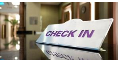
เช็คอินเข้าโรงแรมปูซาน

พาท่านสัมผัสประสบการณ์ใหม่กับการนั่งสกายแคปซูล บนรางรถไฟลอยฟ้า เลียบทะเลแฮอนแด เมืองท่าอันดับ1ของประเทศเกาหลีใต้ ตัวแคปซูลหนึ่งคันจะนั่งได้ 4ท่าน แต่ละแคปซูลก็จะมีสีสันสดใส น้ำเงิน แดง เหลือง เขียว เล่นสลับๆกันไป สีสวยตัดกับท้องฟ้า เล่นคู่ขนานกับรถไฟขมทะเลด้านล่าง ระหว่างนั่งในแคปซูลท่านจะได้ชมวิวเมืองปูซานได้ทั้งซ้ายและขวา แคปซูลจะเล่นช้าๆให้เราไปชื่นชมความงาม ของวิวทะเล และวิวตัวเมือง ถือว่าเป็นที่เที่ยวเปิดใหม่ล่าสุด ที่นำไปเที่ยวมากๆเลยทีเดียว