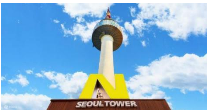
คืนได้แบบ 360 องศา

สวนสนุกล็อตเต้เวิลด์ สวนสนุกในร่มที่มีเครื่องเล่นมากมาย โดยพื้นที่ภายในจะแบ่งเป็น 2 โซนใหญ่ๆ คือ Adventure เป็นสวนสนุกในร่มที่รวมเครื่องเล่นไว้มากมาย ทั้งไวกิ้ง ม้าหมุน บ้านผีสิง ฯลฯ รวมถึงมีลานไอซ์สเก็ตในร่มอีกด้วย ส่วนอีกโซนชื่อว่า Magic Island เป็นโซนกลางแจ้ง อยู่ติดกับทะเลสาบชกซอนไฮชู มีปราสาทสวยๆ ตั้งเด่นเป็นสง่า ตรงนี้แหละจะเป็นจุดถ่ายรูปที่คนเกาหลีฮิตมากๆ ถ้าจะให้ปังสุดๆ ต้องเช่าชุดนักเรียนน่ารักๆ มาใส่ถ่ายรูปด้วยนะ โซนกลางแจ้งมีเครื่องเล่นไฮไลท์เป็น Gyro Drop ดรอปทาวเวอร์ สูง 70 เมตร และเครื่องเล่นมันส์ๆ อีกมากมาย ใครชอบความท้าทายต้องไม่พลาด